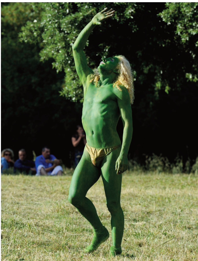
Dances libres, festival d'Uzès 2010.

Mardi 31 janvier 2012 et mercredi 1 er février à 20h30