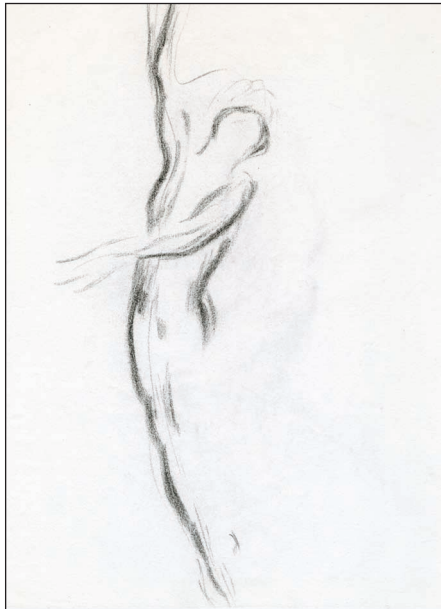
Dessin : James Hodges.

Ainsi la pensée de Malkovsky se traduit par :